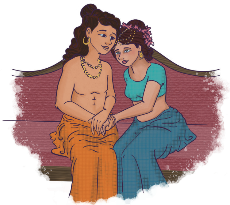
第五行谊：受用妃眷