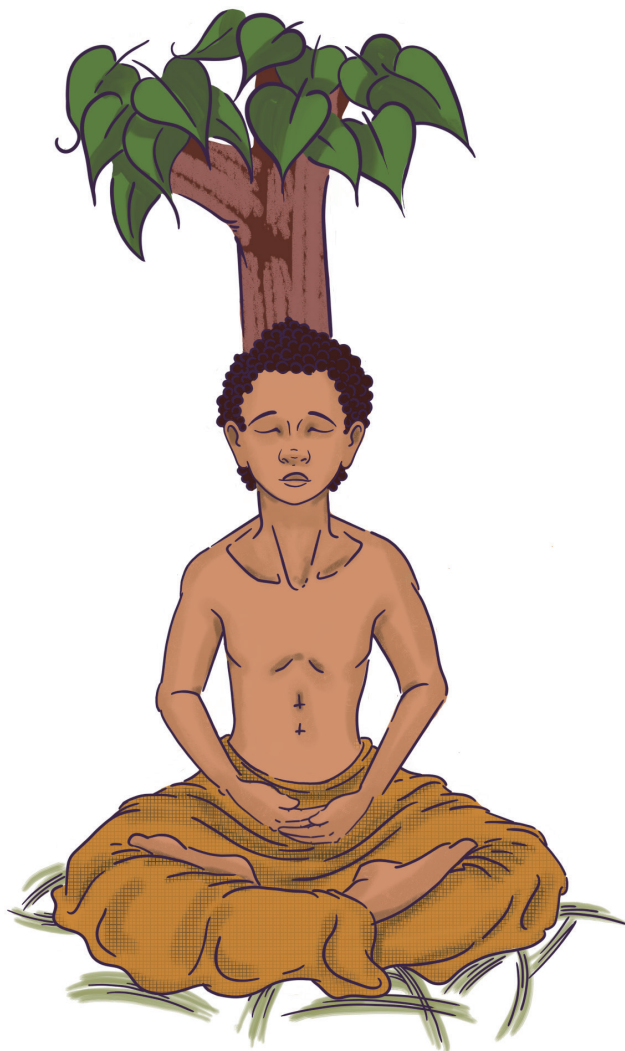
第八行谊：趋向金刚座