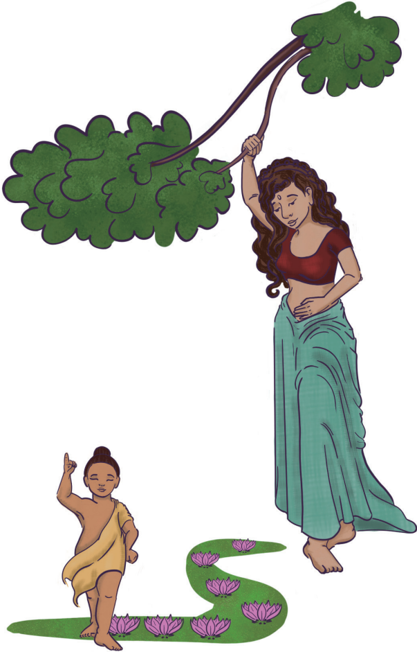
第三行谊：圆满诞生