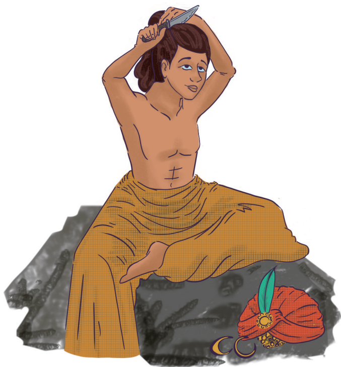
第六行谊：从家出家