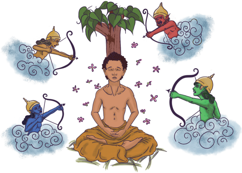
第九行谊：调伏魔军