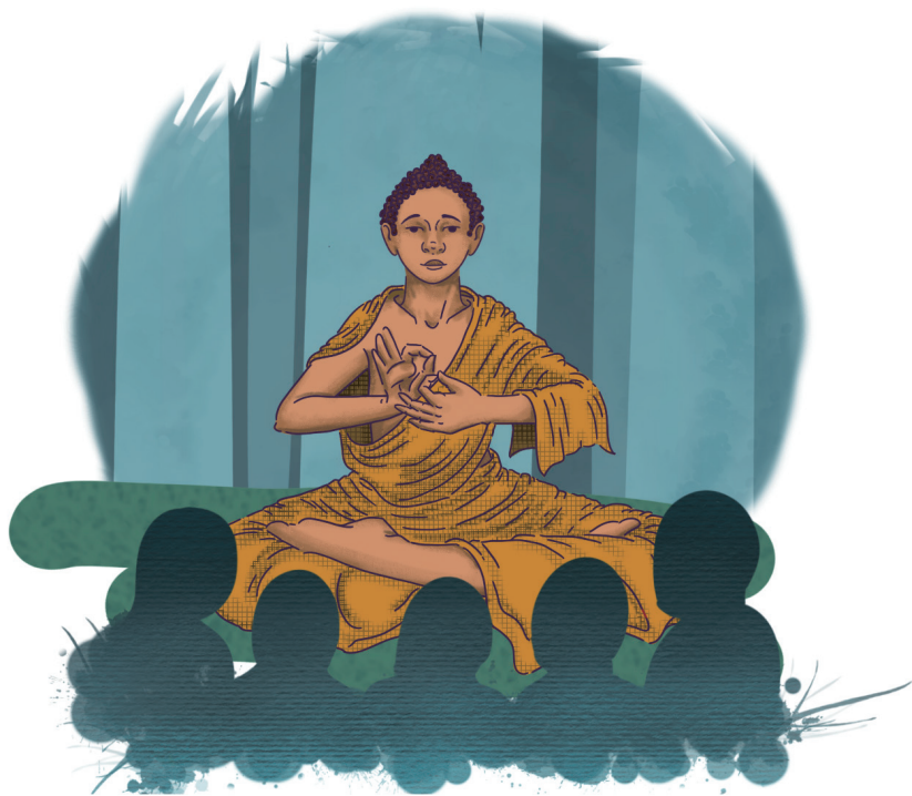
第十一行谊：转妙法轮