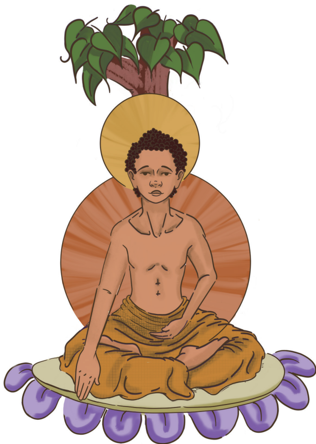
第十行谊：成正等觉